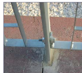
Detalle unión cerramientos religa