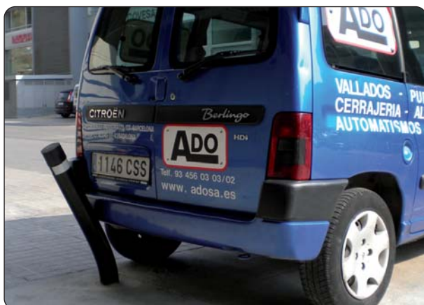
Detalle flexión de la pizona City de caucho reciclado macizo al impactar con un vehículo.

Bajo pedido posibilidad de personalización con logo o texto identificativo del Municipio.