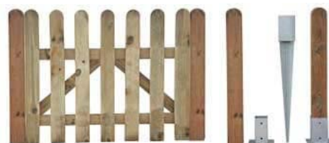
Detalle puerta 1 hoja, postes. Anclajes para postes de 7x7 y 9x9 cm y piqueta.