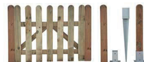
Detalle puerta 1 hoja, postes. Anclajes para postes de 7x7 y 9x9 cm y piqueta.