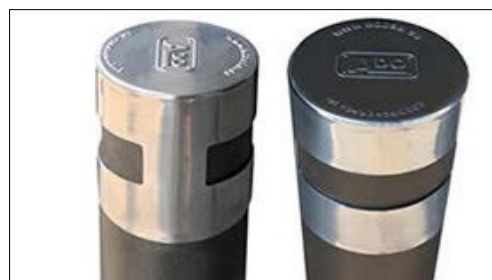
Detalle parte superior pilona urban.