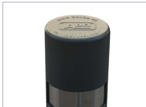
Detalle grabado del logo en pilona.