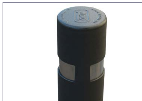
Detalle refuerzo pilona evitando así la rotura de la parte superior.

ADO, SA. se reserva el derecho a modificar las especificaciones de los productos sin previo aviso.