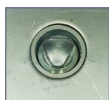
Detalle cerradura llave triangular