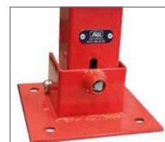
Opcional: llave triangular.