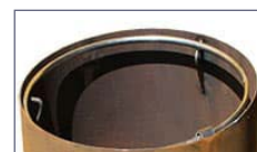
Aro sujeción bolsas.