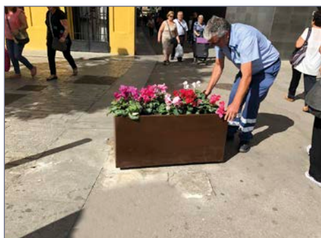
Detalle del bloqueo de la jardinera en el punto final.