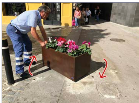
Inicio del sistema de giro de la jardinera.