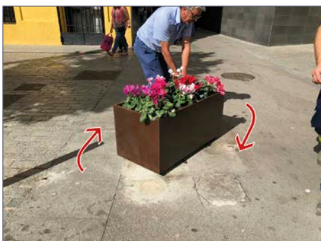
La jardinera gira 360º pudiendo elegir el recorrido en el momento de la instalación.