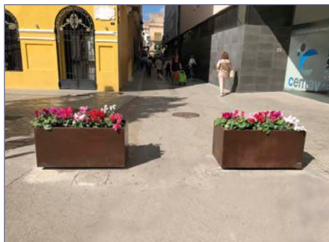
Jardineras en posición cerrada evitando el paso de vehículos.