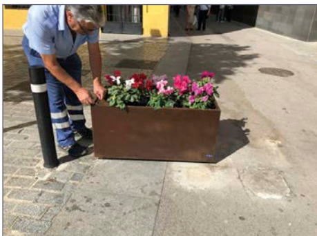
Detalle de apertura del bloqueo de la jardinera.