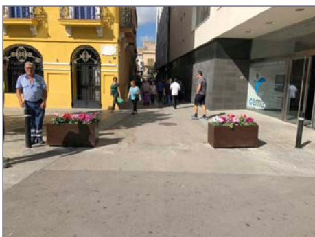
Jardineras en posición abierta para permitir el paso de vehículos.

Jardinera de seguridad antialunizaje construida especialmente para resistir los actos vandálicos de alunizaje de vehículos.