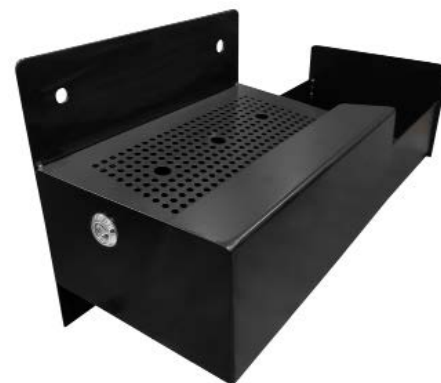
Detalle cenicero abierto.