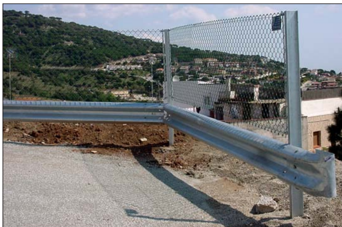
Trabajo hecho a medida, combinando valla bionda y vallado simple torsión.