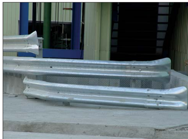
Valla bionda de tres alturas, acabado final de barrera en cola de pez.