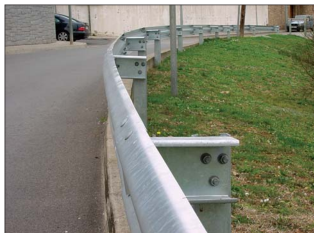
Valla bionda adaptada al trazado de la carretera.