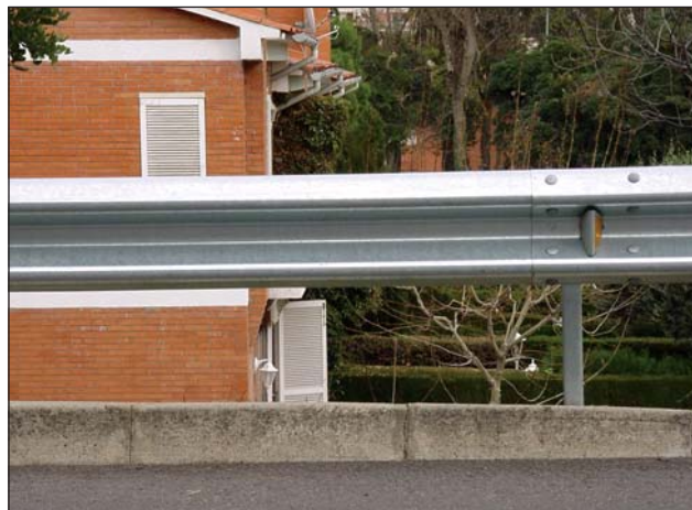
Bionda recta standard, con catadióptrico.