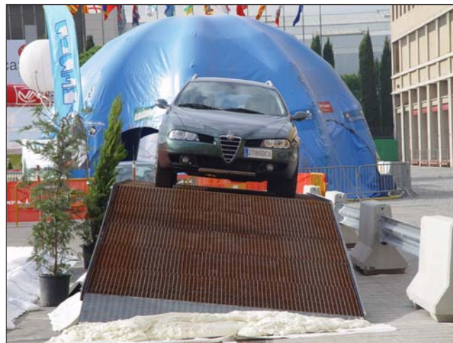
Rampa metálica de religa para vehículos.