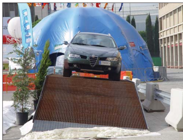
Rampa metálica de religa para vehículos.