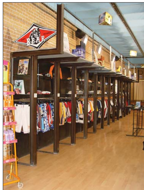
Estantería de hierro tienda.