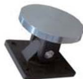
Electroiman con carcasa y botón