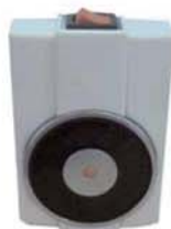
Placa anclaje articulada para electroiman