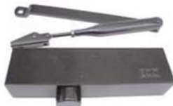
Muelle aéreo con brazo color negro