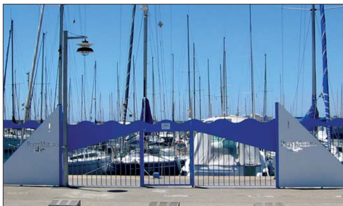
Puerta con fijos y lateral de chapa con logo perforado a láser.

Posibilidad de apertura manual o automática según necesidades cliente.