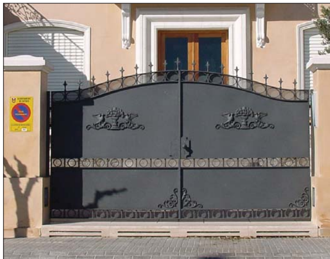
Puerta batiente de forja a dos hojas.