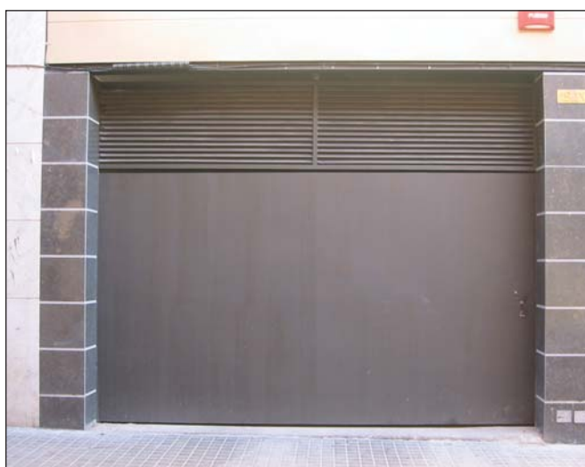
Puerta batiente construida con chapa lisa de una hoja y con lamas de ventilación superiores.