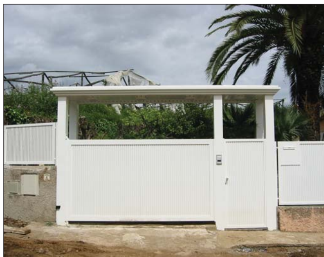
Conjunto puertas batientes para paso de vehículos y peatones construida con lama ovalina vertical.