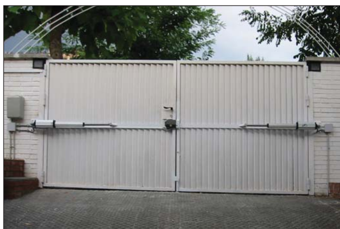
Parte interior puerta dos hojas chapa acanalada vertical y detalle motores.