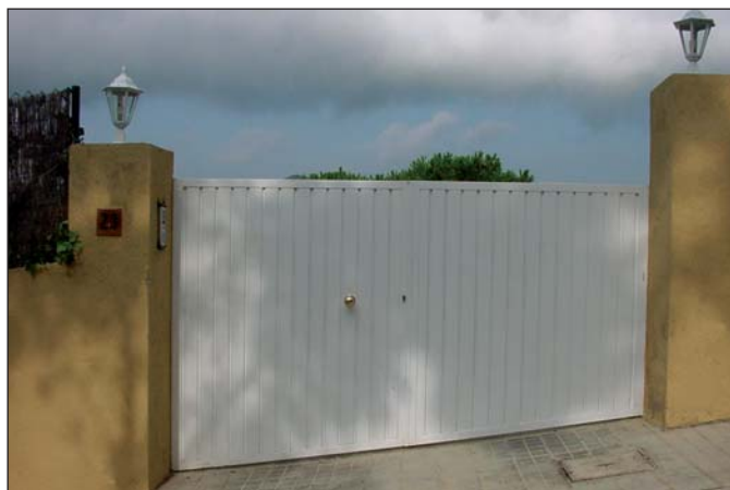
Puerta batiente chapa acanalada en posición vertical.