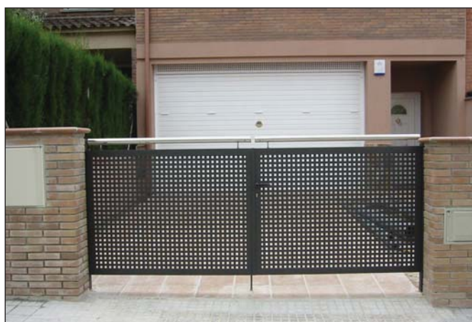
Puerta batiente dos hojas chapa perforada.