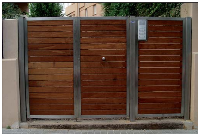
Puerta de acero inoxidable y lamas de madera.