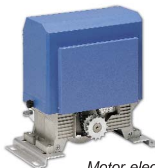
Motor electromecánico industrial.