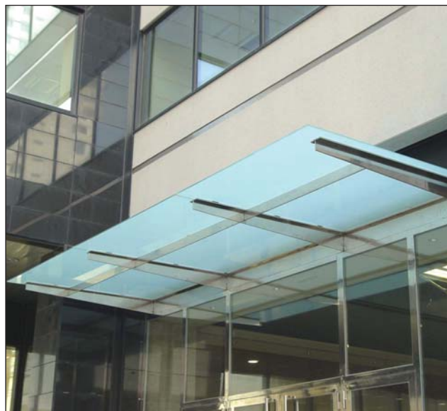
Marquesina vidrio inoxidable.

Marquesina hierro con estructura metálica y cubierta de policarbonato celular.