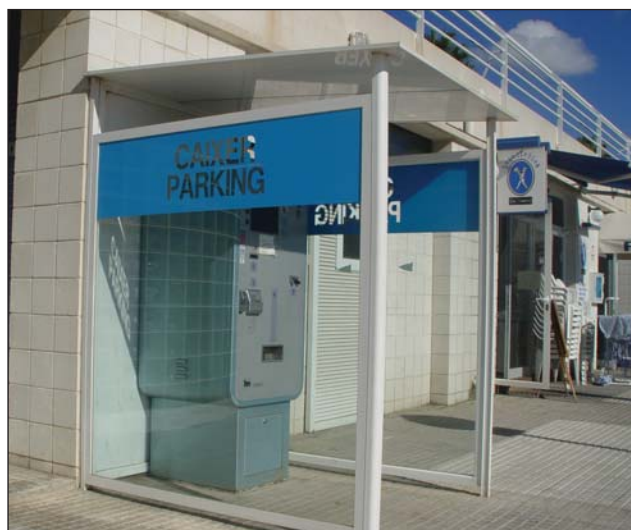
Marquesina para cajero automático