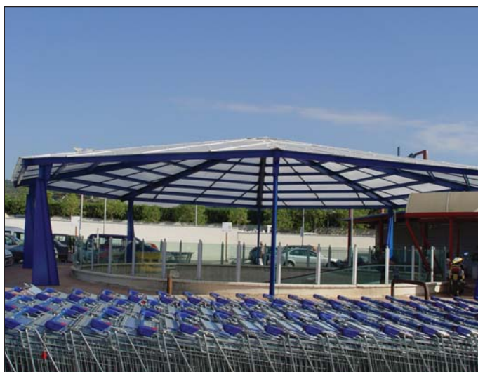
Marquesina estructura en acero y policarbonato.