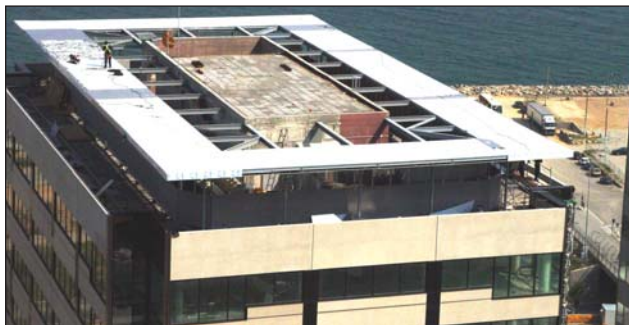
Marquesina alucobond en cubierta edificio.