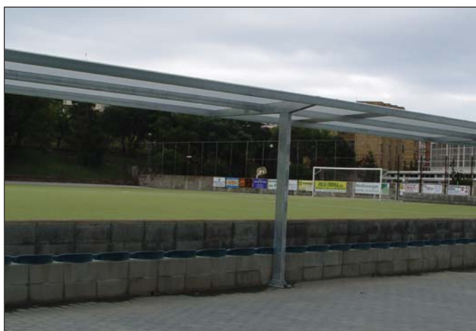
Marquesina gradas campo de fútbol.