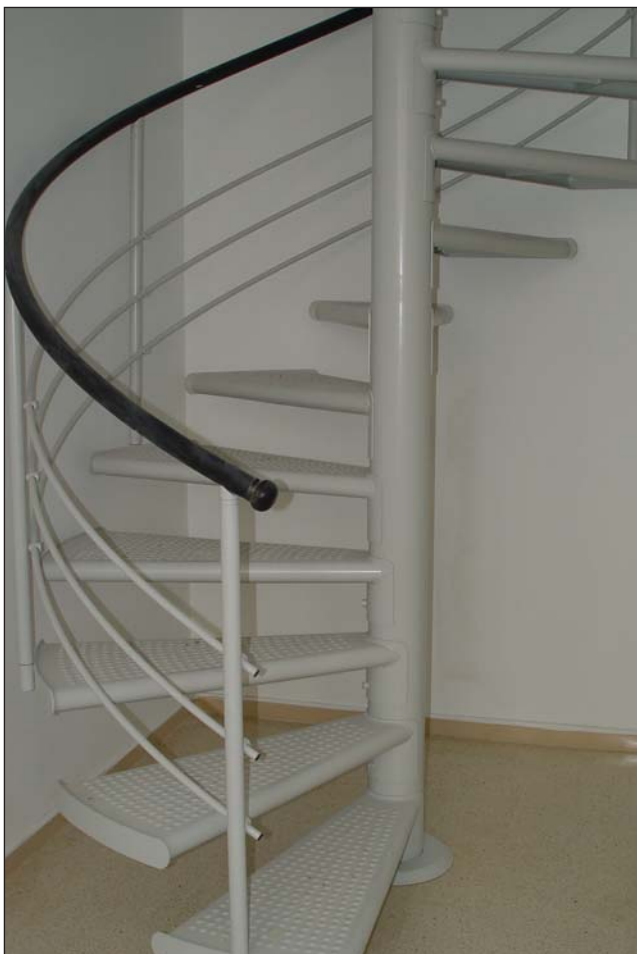
Escalera metálica de caracol con peldaños de chapa.