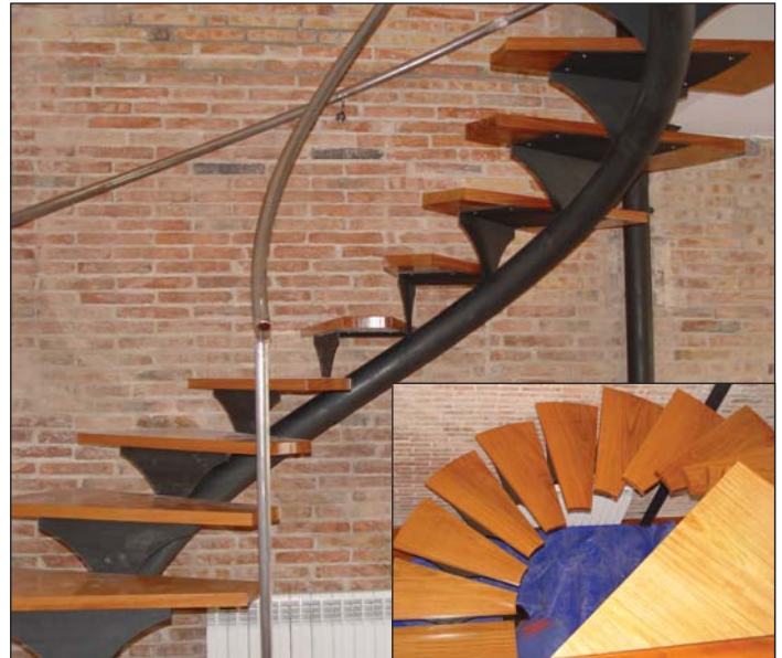
Escalera helicoidal de tubo central helicoidal con peldaños de madera.