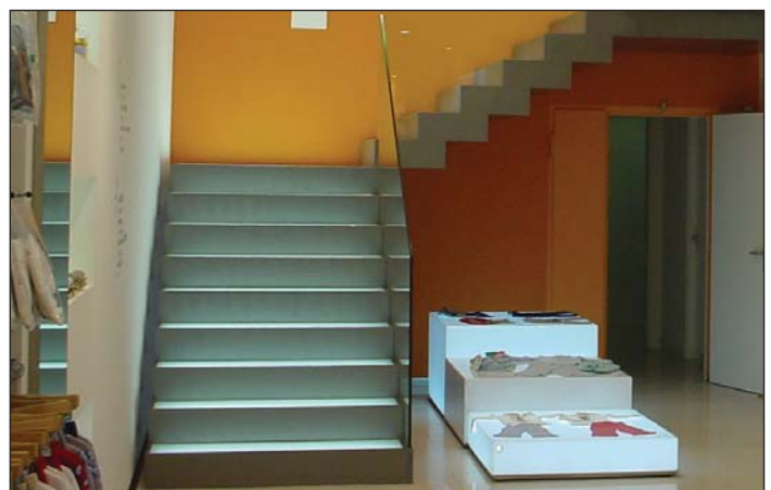
Escalera recta de vidrio pisable y barandilla de vidrio.