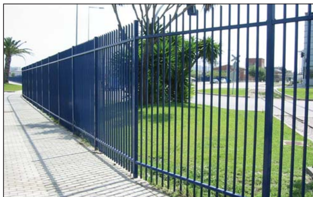
Cerramiento ZF lacado azul.

Acabados: Hierro negro, galvanizado, pintado o lacado color a elegir.