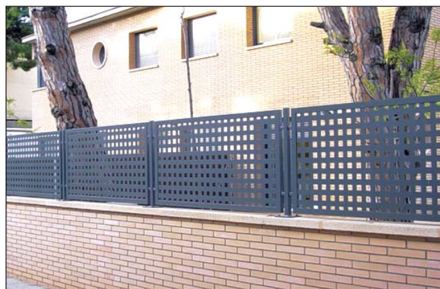
Valla chapa perforada.