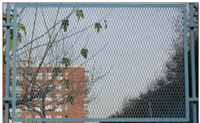
Cerramiento deploye lacado azul.

Estos cerramientos son idóneos para fabricas, escuelas, parques, recintos deportivos, etc.