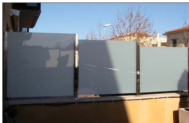
Divisoria de vidrio laminado y acero inoxidable.