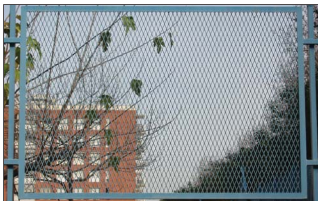
Cerramiento deploye lacado azul.

Estos cerramientos son idóneos para fabricas, escuelas, parques, recintos deportivos, etc.