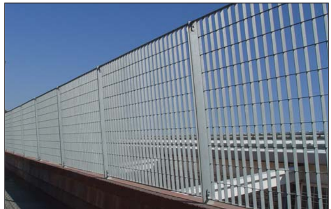
Cerramiento religa inclinada galvanizada.

Hierro negro, galvanizado, pintado o lacado color a elegir. Acero inoxidable.