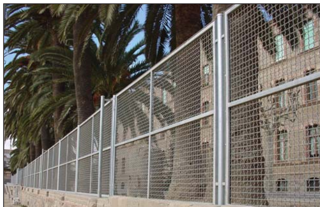
Tela ondulada reforzada galvanizada.

Hierro negro, galvanizado, pintado o lacado color a elegir.