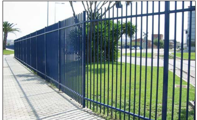
Cerramiento ZF lacado azul.

Acabados: Hierro negro, galvanizado, pintado o lacado color a elegir.