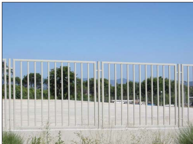
Cerramiento metálico a base de barrotes verticales.

Cerramiento de barrotes reforzado con brazo inclinado del mismo tubo y refuerzo superior unido con varillas interiores.