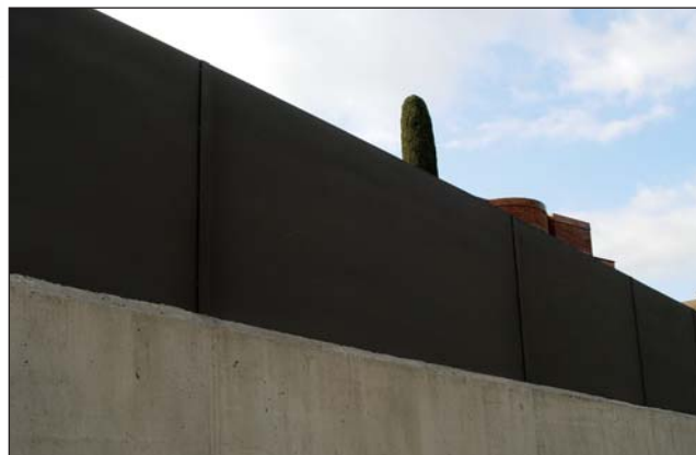
Valla chapa lisa dos caras acabado oxirón negro.

Hierro negro, galvanizado, pintado o lacado color a elegir. Acero inoxidable. Aluminio.