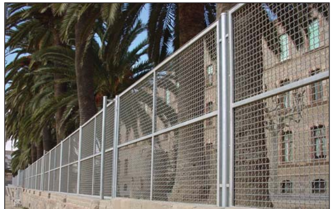
Tela ondulada reforzada galvanizada.

Hierro negro, galvanizado, pintado o lacado color a elegir.