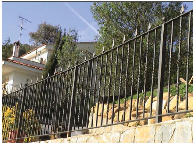
Cerramiento forja con barrotes torneados y puntas de lanza.

Acabado en hierro negro, pintado en oxirón o hierro lacado color a elegir.