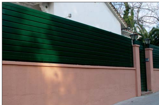
Valla chapa nervada.