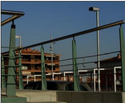
Barandilla con cartelas macizas. Varillas y tubo superior de acero inoxidable.