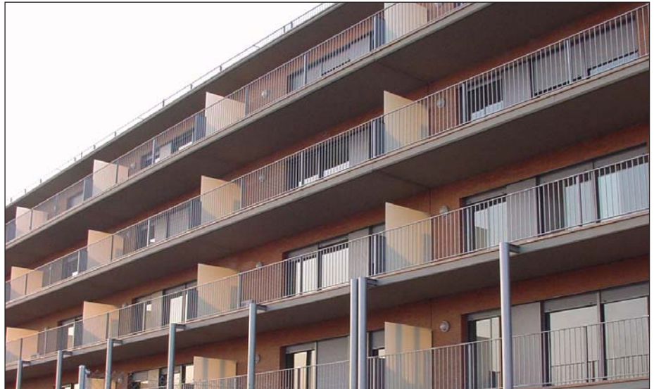
Barandillas balcón edificio con varillas macizas y pasamano superior.