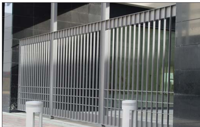
Reja reforzada diseño EP.