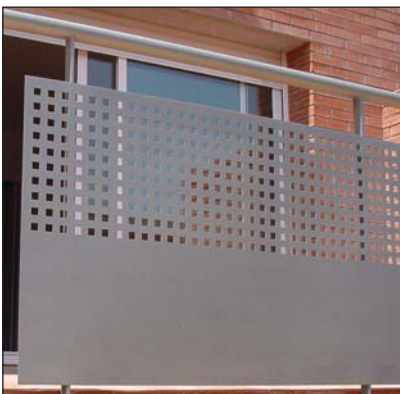
Barandilla chapa perforada.