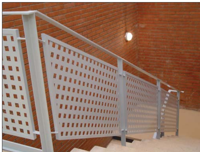
Barandilla de chapa perforada.