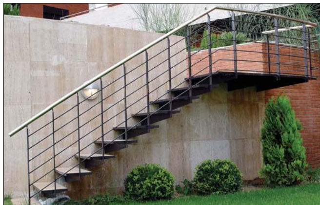
Barandilla de hierro y acero inoxidable.