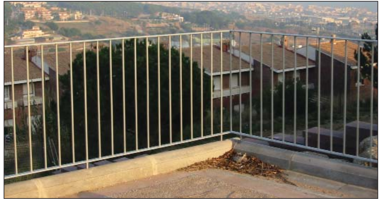
Barandilla de barrotes macizos galvanizados.

Posibilidad de combinar con perfiles de acero inoxidable, cables de acero inoxidable, vidrios (transparentes, mates,...), chapas (lisas, perforadas...).