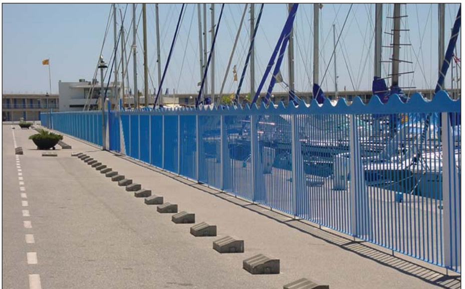
Barandilla maciza galvanizada y lacada con detalle superior