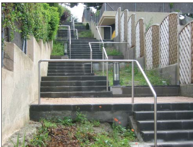
Barandilla de tubo.