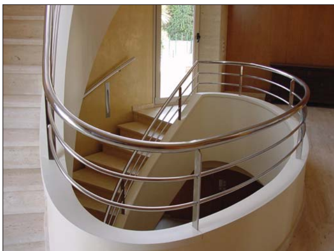
Barandilla interior tubular diseño arquitecta Mb.