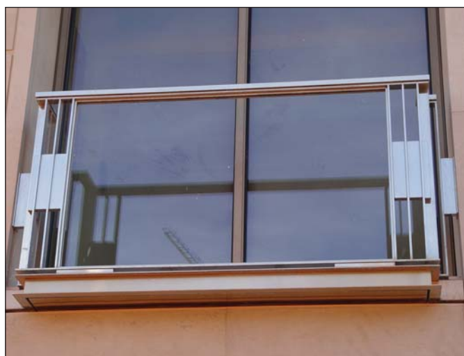
Balcón construido diseño ESTUDIO OJINAGA.