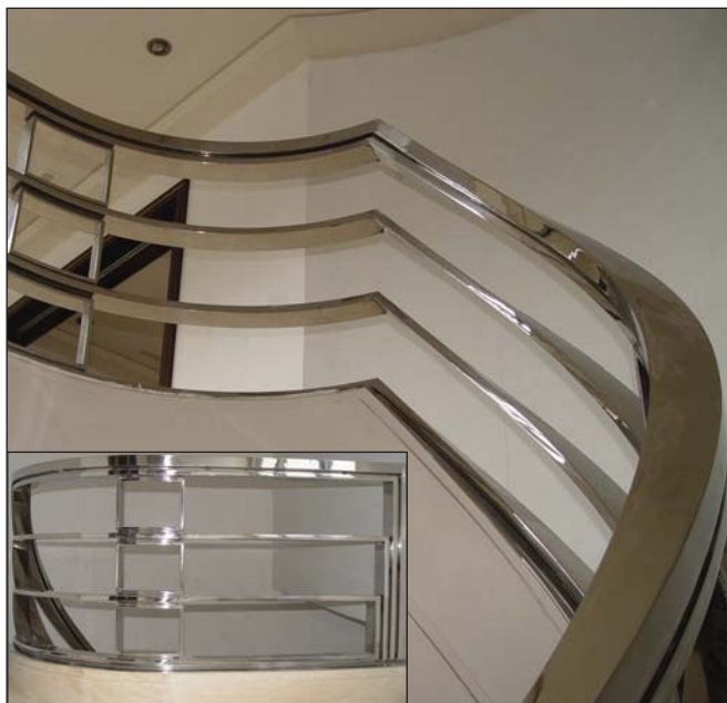
Barandilla diseño ESTUDIO OJINAGA.