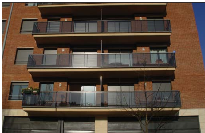
Balcones combinación de hierro, acero inoxidable y vidrio.

Acero inoxidable acabado en brillo o mate. Calidad Aisi 304 o calidad marina Aisi 316. Combinación de inoxidable y otros materiales.