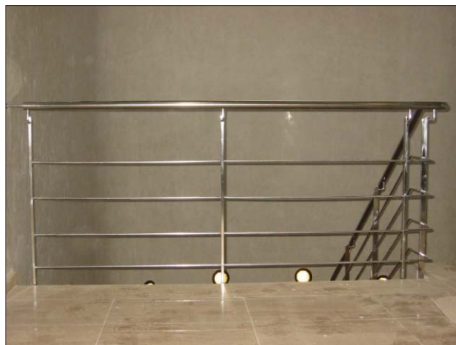
Barandilla tubo rectangular y pasamano circular.