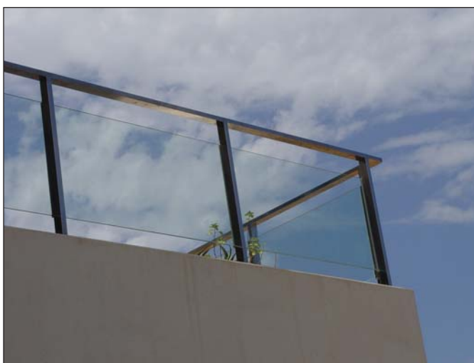
Barandilla de acero inoxidable y vidrio.