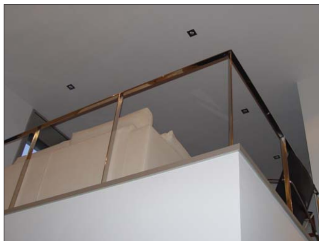
Barandilla de pasamano de acero inoxidable.