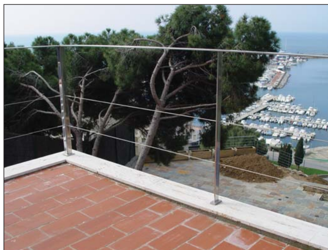
Barandilla con cable de acero inoxidable.